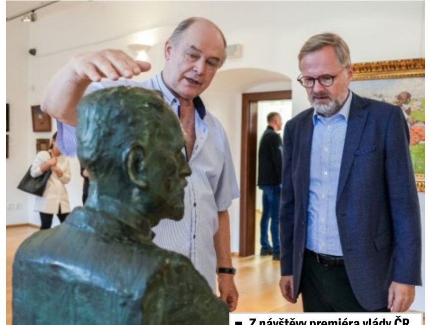
■ Z návštěvy premiéra vlády ČR Petra Fialy.

žil a tvořil známý a můj oblíbený český malíř Otakar Kubín. Zůstává tam po něm nemovitost, o kterou radnice pečuje. Když jsem před lety starostovi Simiane předával jako dárek větší zarámovanou reprodukcí Kubínova obrazu, pohled na Simiane z přelomu 19. a 20. století, o který mě starosta požádal, šlo dle jeho slov o událost, kterou sledovali snad všichni místní občané. Obraz dodnes zdobí zasedací síň radnice. Myslím, že právě to je příklad hodný následování. I v Simiane a jinde ve Francii mají své problémy spojené s výkonem státní správy, ale to nesnižuje jejich zájem o památky o ty, kteří se zasloužili o jejich obec či město. Uprka vždy považoval Uherské Hradiště za svoje město, přirozené centrum Slovácka. Obřadní síň radnice mimo jiné zdobí