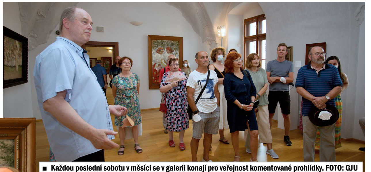
■ Každou poslední sobotu v měsíci se v galerii konají pro veřejnost komentované prohlídky.