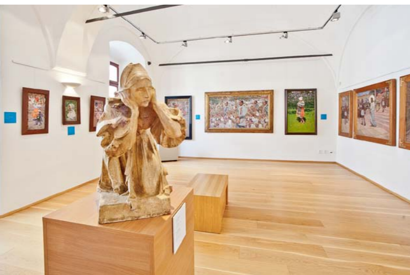
Jeden ze sálů expozice