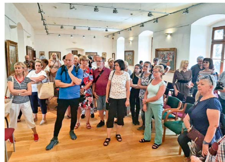
Komentovaná prohlídka