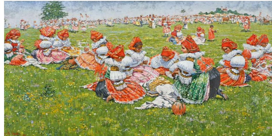
Joža Uprka, Poslední velká pouť u sv. Antonínka, foto: Galerie Joži Uprky