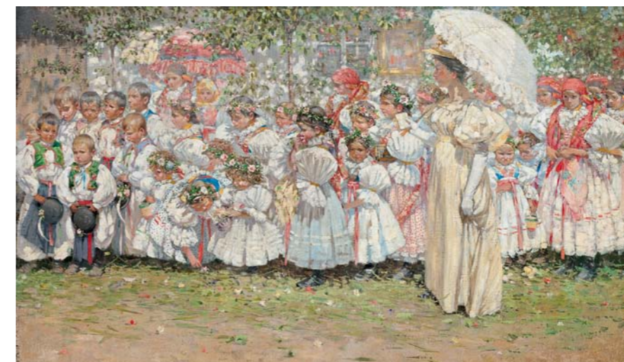
Joža Uprka, Boží tělo v Hroznové Lhotě, 1894