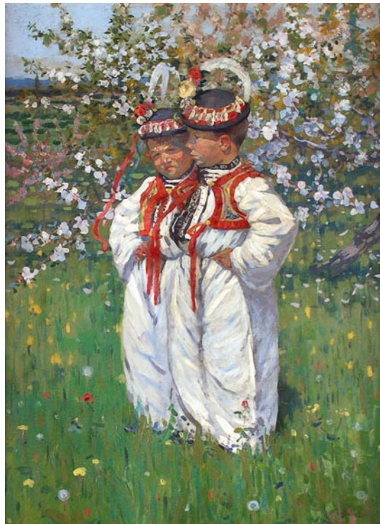
Joža Uprka, Dva chlapci ve slováckém kroji, foto: Galerie Joži Uprky