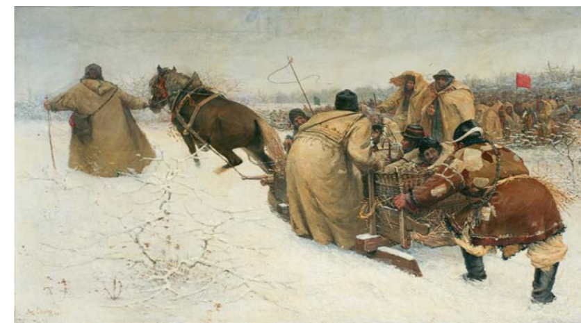
Joža Uprka, Zkouška koně na tarmaku, foto: Galerie Joži Uprky